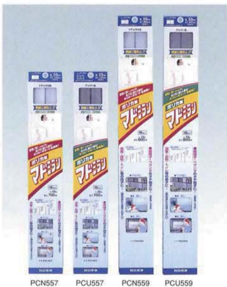
PCN557 PCU557 PCN559 PCU559